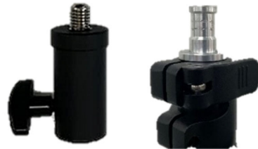
照明本体接続治具とスタンションの上端部